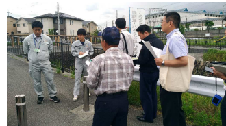
合同での交通安全対策 現地調査の様子

今回の要望は、地域の課題を市に認知してもらい、検討のテーブルに乗った段階(ようやくスタートラインに立った段階)です。その後の状況についてはすみれ野通信等でお知らせします。