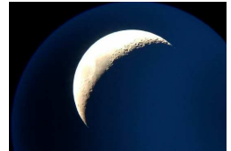
クレータまではっきり