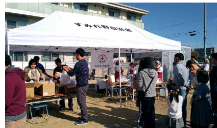
常温で食べられるカレーレトルトパックの配布を実施