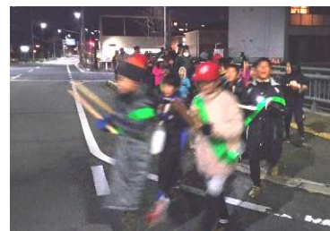
声を張って地域内を練り歩き、体はボカボカです。