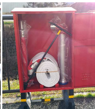
普段からお近くのホース格納箱の場所を把握しておいてください