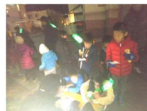
途中のスタンプラリースポットの様子

12月29日、「火の用心」の夜回り体験を実施しました。寒い夜にも関わらず、子供46名・大人38名の総勢80名を超える方が集まり、「火の用心！マッチ一本火事の元！火の用心」と声を張り拍子木を打って注意喚起をしながら、すみれ野地域内を約45分かけて練り歩きました。スタンプラリーやお菓子のプレゼントなど、子供向けのお楽しみ企画もありました。ご参加いただいた皆様、ありがとうございました。