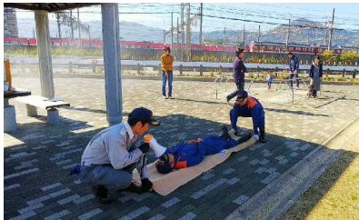
服や毛布の簡易担架による訓練