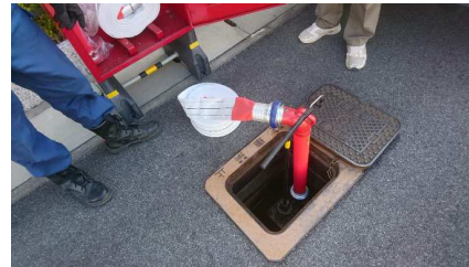
消火栓にホース接続器具を取り付けた様子