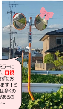
カーブミラーに頼らず、 目視 を忘れずお願いします！ミラーには多くの死角があるのですよ～

【カーブミラー・路側帯(白線)】これまで市へ要請していた「カーブミラー」と「路側帯」が8月に設置されました。路側帯については、警察から「速度規制実施の前提条件として必要」とのことで要望していましたが、最近ではさらにハード面での安全対策を実施した上で、危険な場合のみ速度規制となるとのことで、速度規制実現のハードルが上がっています。